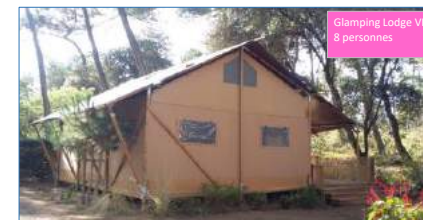
Glamping Lodge VIP 8 personnes