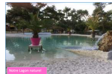
Notre Lagon naturel!

Toutes les options supplémentaires sont uniquement sur réservation et selon disponibilité. Aucune annulation ne sera acceptée le jour de l'arrivée.