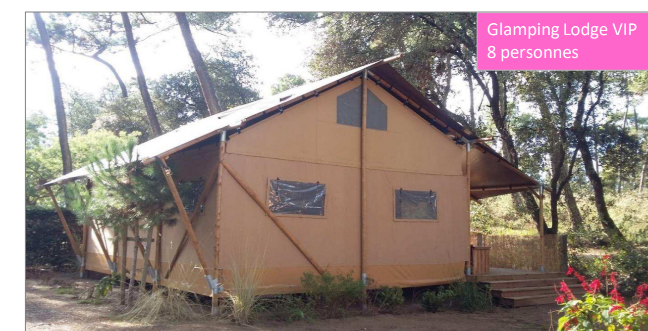
Glamping Lodge VIP 8 personnes